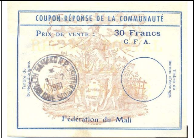
09: Mali 30 Francs C.F.A.