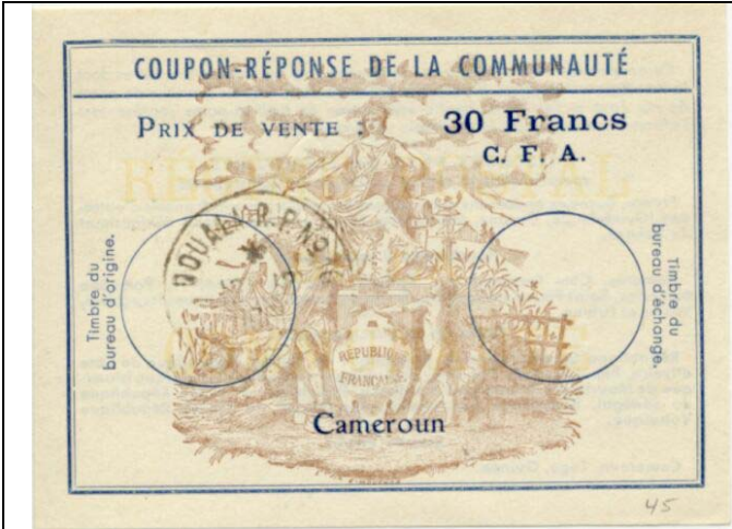
09: Cameroon 30 Francs C.F.A.